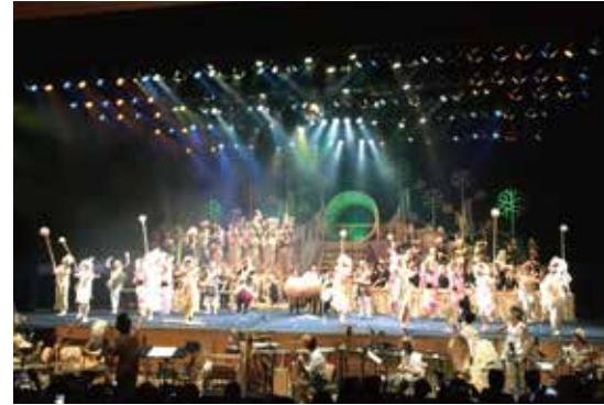
ミュージカル・伝統音楽・フィドル・のこぎりのメンバーは、毎年音絵巻にも出演。年齢を問わず、みんなで音楽をたのしんでいる。(2017年9月奥河内音絵巻より)

5年目を迎える「奥河内音絵巻」(以下、音絵巻)が、9月15日に開催決定。2年連続チケット完売のこのコンサートは、芸術監督サキタハチメ氏率いるアーティストを軸に、市民メンバーも多く携わり、独自の音の世界を創り上げている。妖精のように踊る子どもたち、フィドルやのこぎりを手し、年齢を問わず嬉々と演奏する人たち。音楽愛好家が集まる