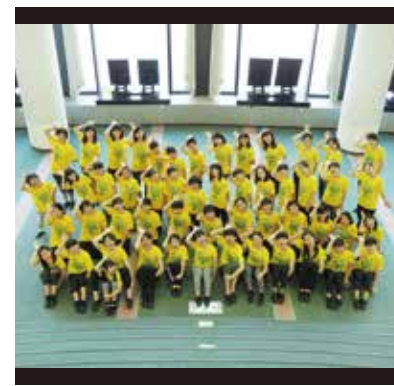
リトルクラス(小学1~3年生)からはじめて大学生まで続ける生徒も多数いる。