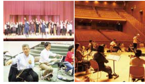
年齢・性別問わず、音楽を通じて仲間ができたのしさ。初心者ウエルカムなアットホームな雰囲気がいい!